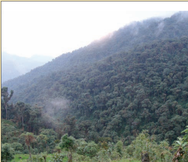
Figura 1. Panorámica del Bosque Nublado en la zona andina de Ecuador (aprox. a 2.600 msnm).

Cada especie vegetal se desarrolla en ámbitos geográficos determinados (latitudinal y altitudinalmente) y tiende a reubicarlos cuando algún cambio la afecta; la eficacia de esta reubicación depende principalmente de su elasticidad fenotípica. Por esta razón, formaciones vegetales andinas como el bosque nublado, el páramo y el superpáramo (Figuras 1, 2, 3 y 4) constituyen elementos paisajísticos móviles en el espacio-tiempo y han variado su ubicación y extensión durante cambios climáticos globales naturales (glaciales e interglaciales) y eventualmente pudieran hacerlo como respuesta a cambios antropogénicos (el Efecto Invernadero, por ejemplo).