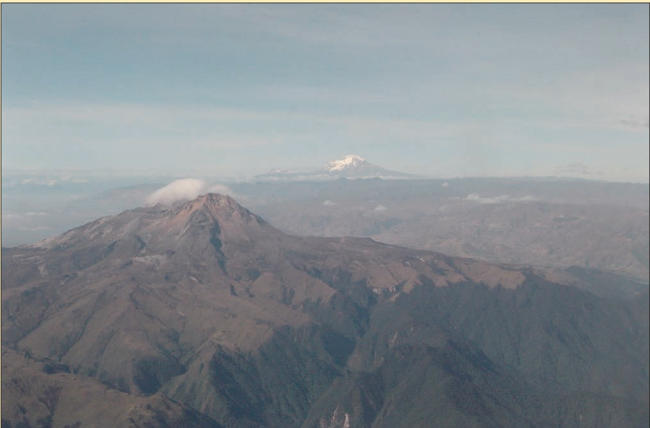
Figuras 2 y 3. Imágenes que muestran la zona de contacto o de intergradación entre el Bosque Nublado y el Páramo en Ecuador (nótese la tonalidad verde oscura típica de bosque nublado y la verde amarillenta típica de páramo, tal zona de contacto se encuentra a aprox. 3.000 msnm).